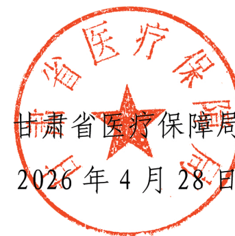
甘肃省医疗保障局