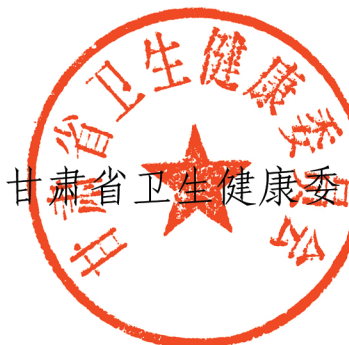
甘肃省卫生健康委员会