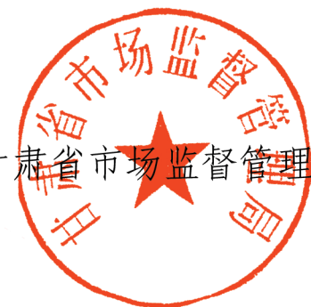
甘肃省市场监督管理局