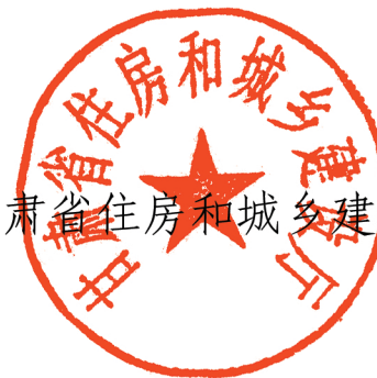
甘肃省住房和城乡建设厅